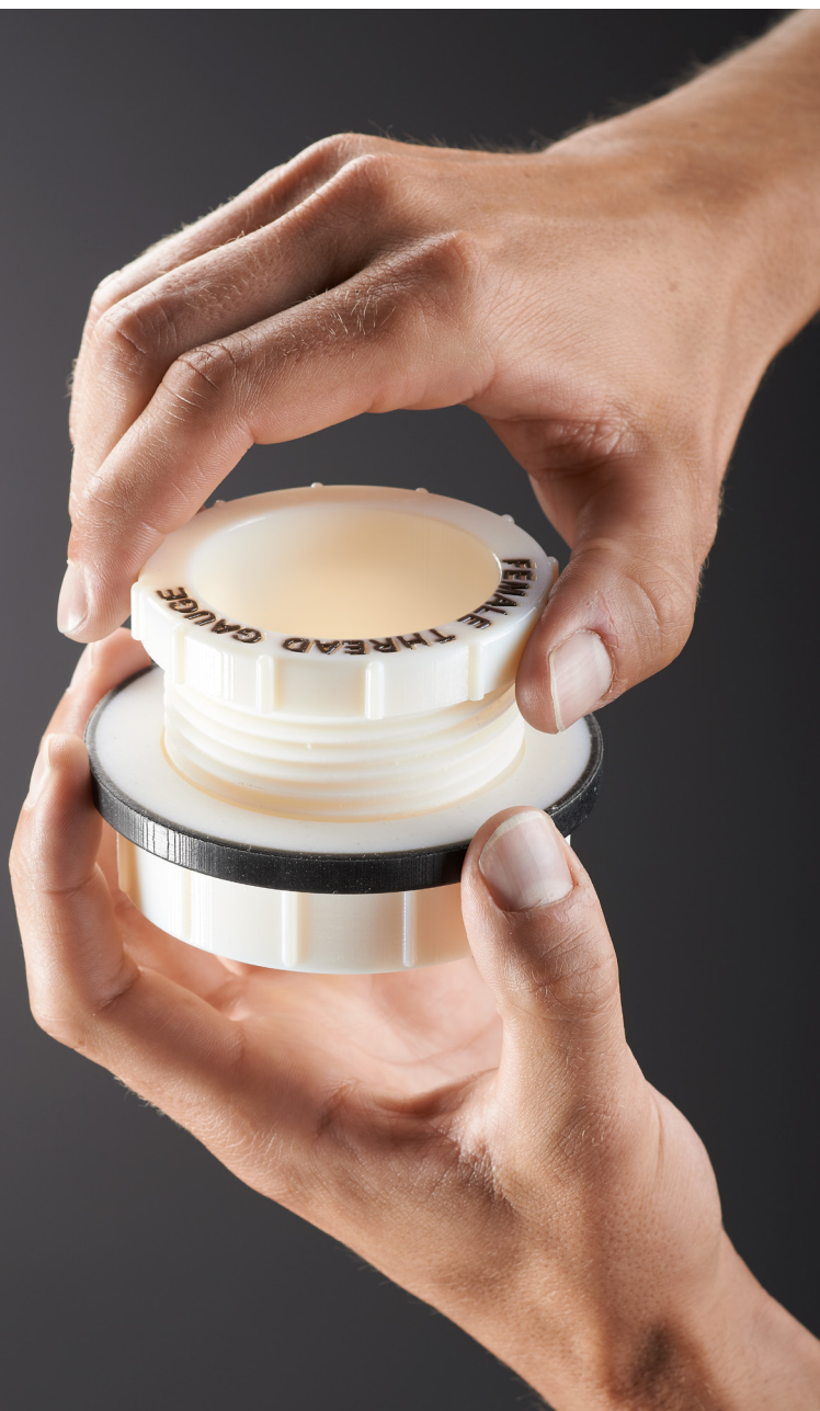
Prototipo de calibre para roscas con componentes macho y hembra

Utilice la familia de materiales Agilus30™ para crear piezas y prototipos flexibles que pueden flexionarse, doblarse, alargarse y sellarse.