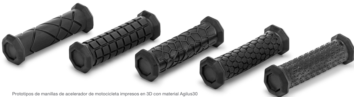
Prototipos de manillas de acelerador de motocicleta impresos en 3D con material Agilus30

Con la J850 Pro, resulta sencillo crear modelos funcionales con múltiples materiales que permiten probar y validar los prototipos más rápido y superar fácilmente la etapa de revisión. El resultado son decisiones y aprobaciones más rápidas, que facilitan la verificación de los productos, aumentan el rendimiento y ahorran un tiempo valioso.